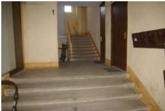
Būve ar kadastra apzīmējumu 1700 002 0140 001, koplietošanas telpa