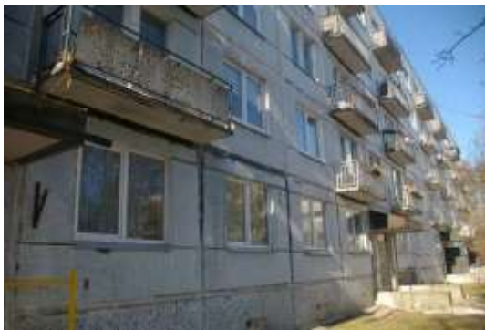
Būve ar kadastra apzīmējumu 1700 002 0140 001