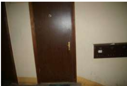
Būve ar kadastra apzīmējumu 1700 002 0140 001, dzīvoklis Nr.19