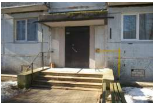
Būve ar kadastra apzīmējumu 1700 002 0140 001